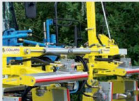
ÉCARTEMENT** hydraulique indépendant des 2 rangs.