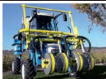
Effeulleuse sur tracteurs interlignes.