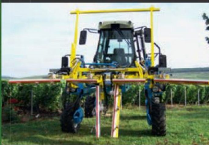
P3200 en position écimage.