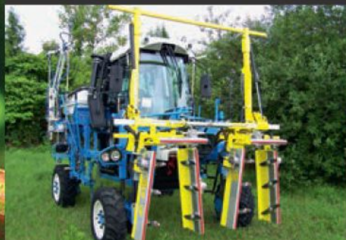
P3200 avec relevage standard.