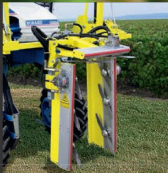
P3000 monorang avec écimage par vérins à gaz.