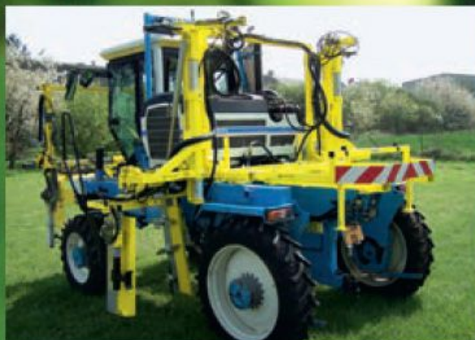
Sur tracteur à voie variable : 2 rangs ou 4 rangs. Le relevage spécifique (Breveté COLLARD) permet aux rogneuses de suivre l'écartement du tracteur et assure au chauffeur une visibilité TOTALE. VERSION 4 rangs avec repli des éléments latéraux sur le plateau.