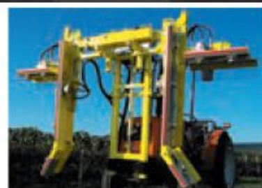
Rogneuse sur tracteurs enjambeurs.