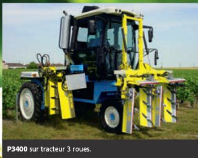
P3400 sur tracteur 3 roues.