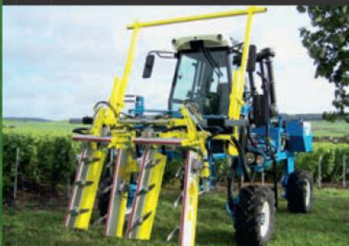
P3200 avec relevage ASCENCEUR.