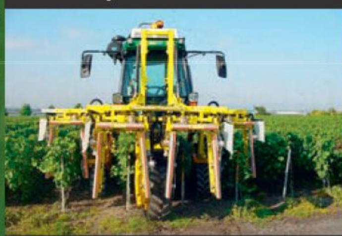
P3400 : 4 rangs complets.

NOUS POUVONS CONCEVOIR TOUS TYPES DE MACHINES SPÉCIALES ET ADAPTONS LA HAUTEUR DE COUPE EN FONCTION DE VOTRE DEMANDE